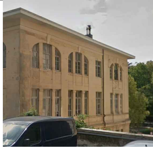
FOTO LATO NORD